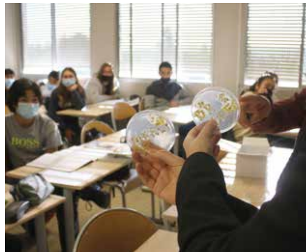
Les élèves ont réussi à écrire le mot « merci » avec des blobs.

(2) Centre national de la recherche scientifique