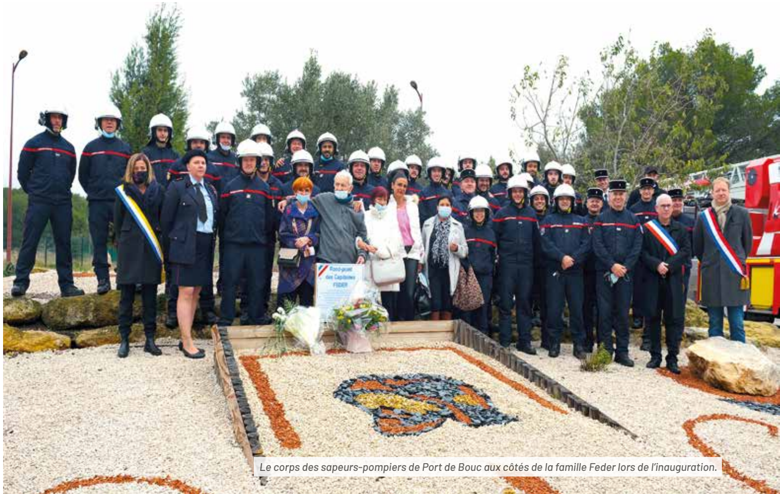
Le corps des sapeurs-pompiers de Port de Bouc aux côtés de la famille Feder lors de l'inauguration.